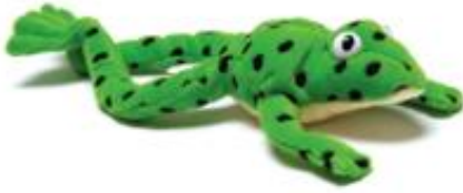
Fred the frog ഫ്രെഡ് തവള